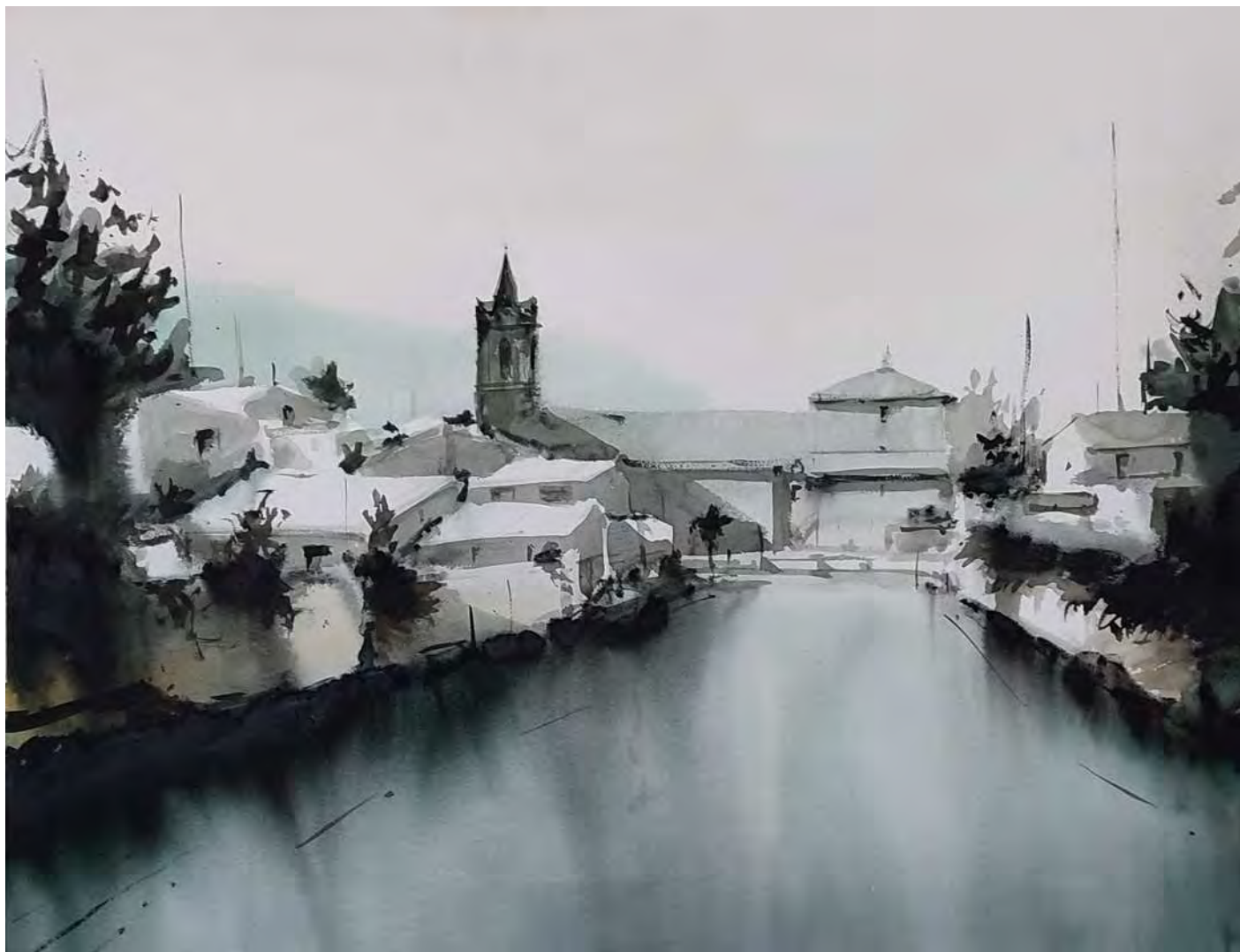
“PUEBLOS” 90x70 cm.