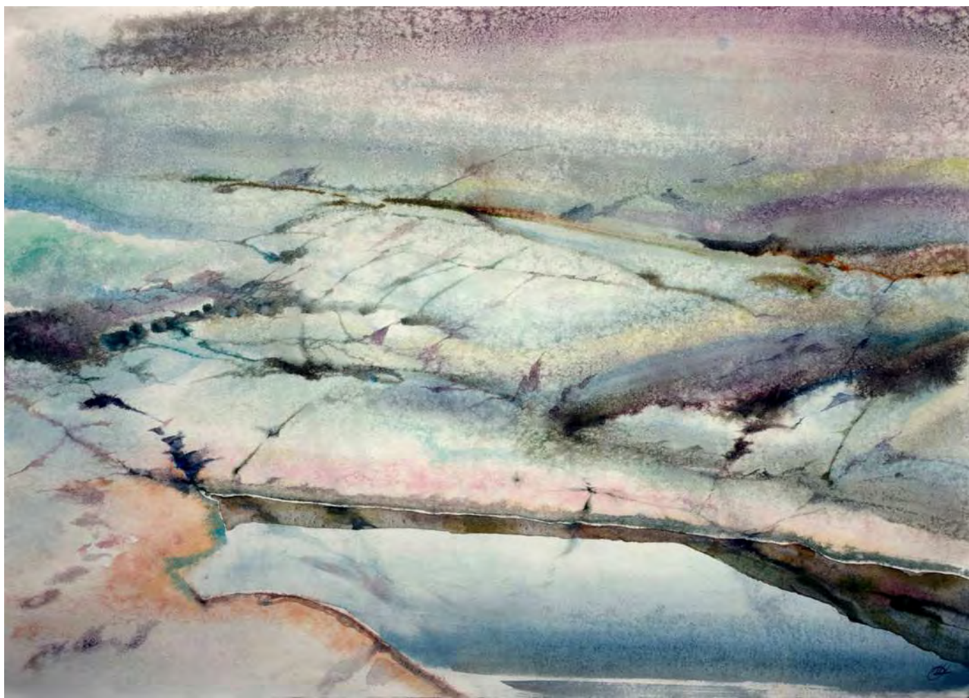
"SHORE" 76x56 cm.