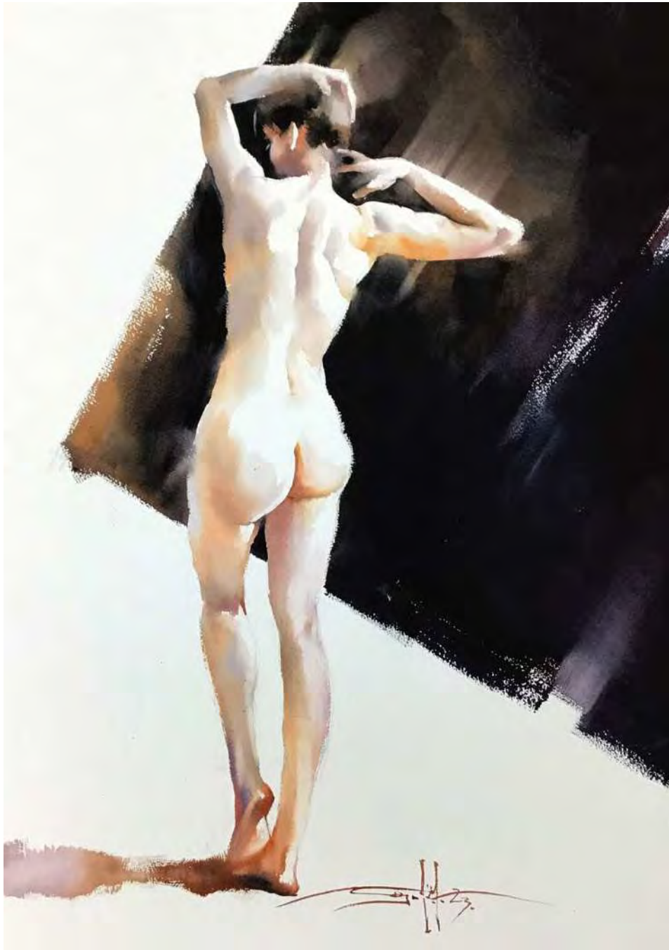
“STANDING MODEL”. 70x100 cm.