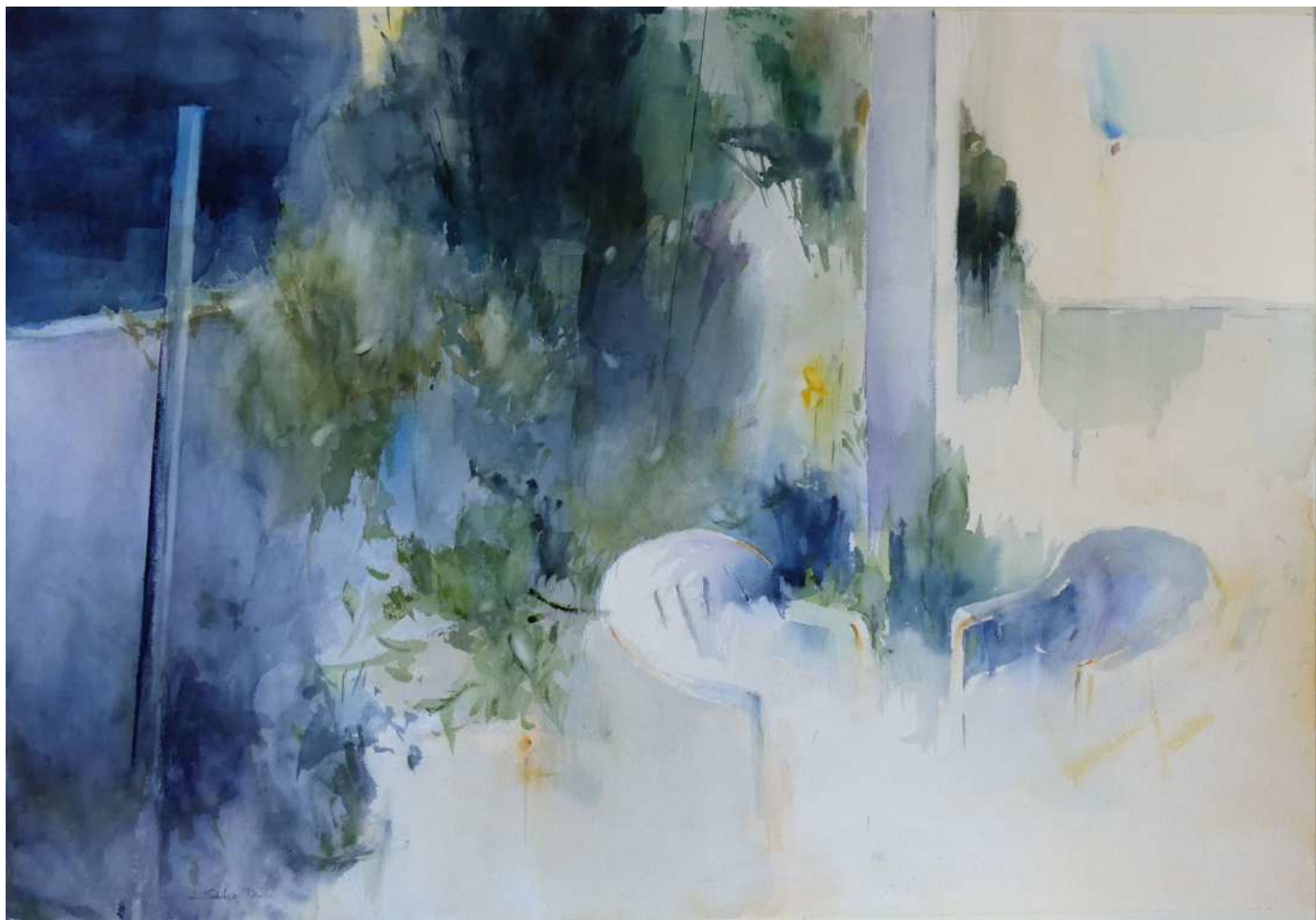
“EN EL JARDÍN” 100x70 cm.