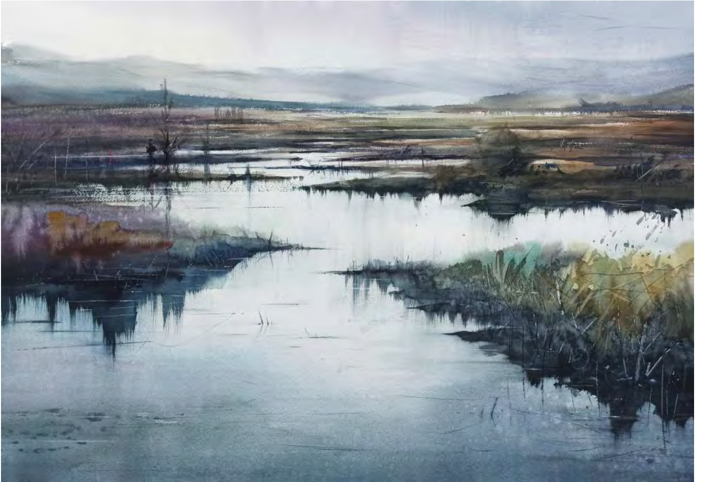
"HUMEDAL" 100x70 cm.