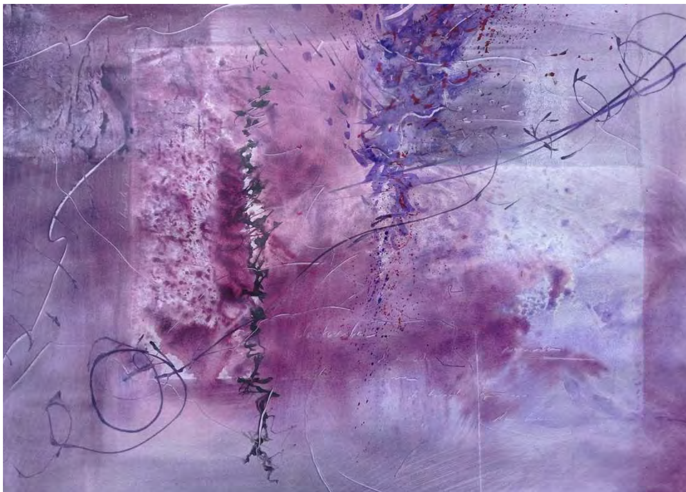
“LA HERIDA QUE NOS UNE “ 57x81 cm.