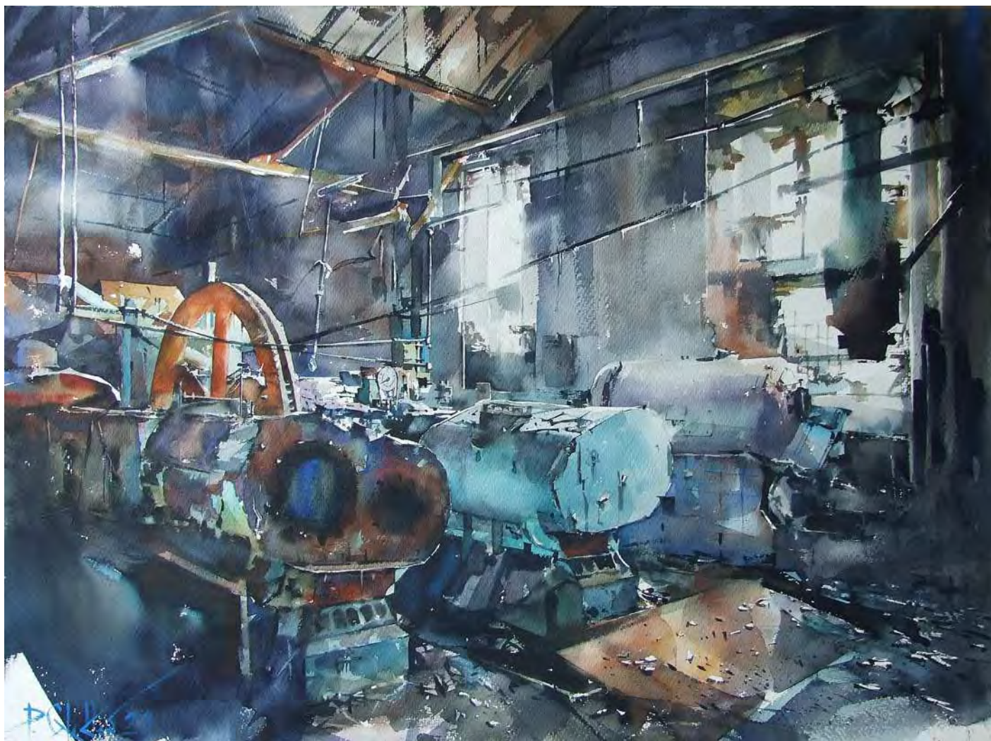
“DEVOLUTION IV” 74x55 cm.