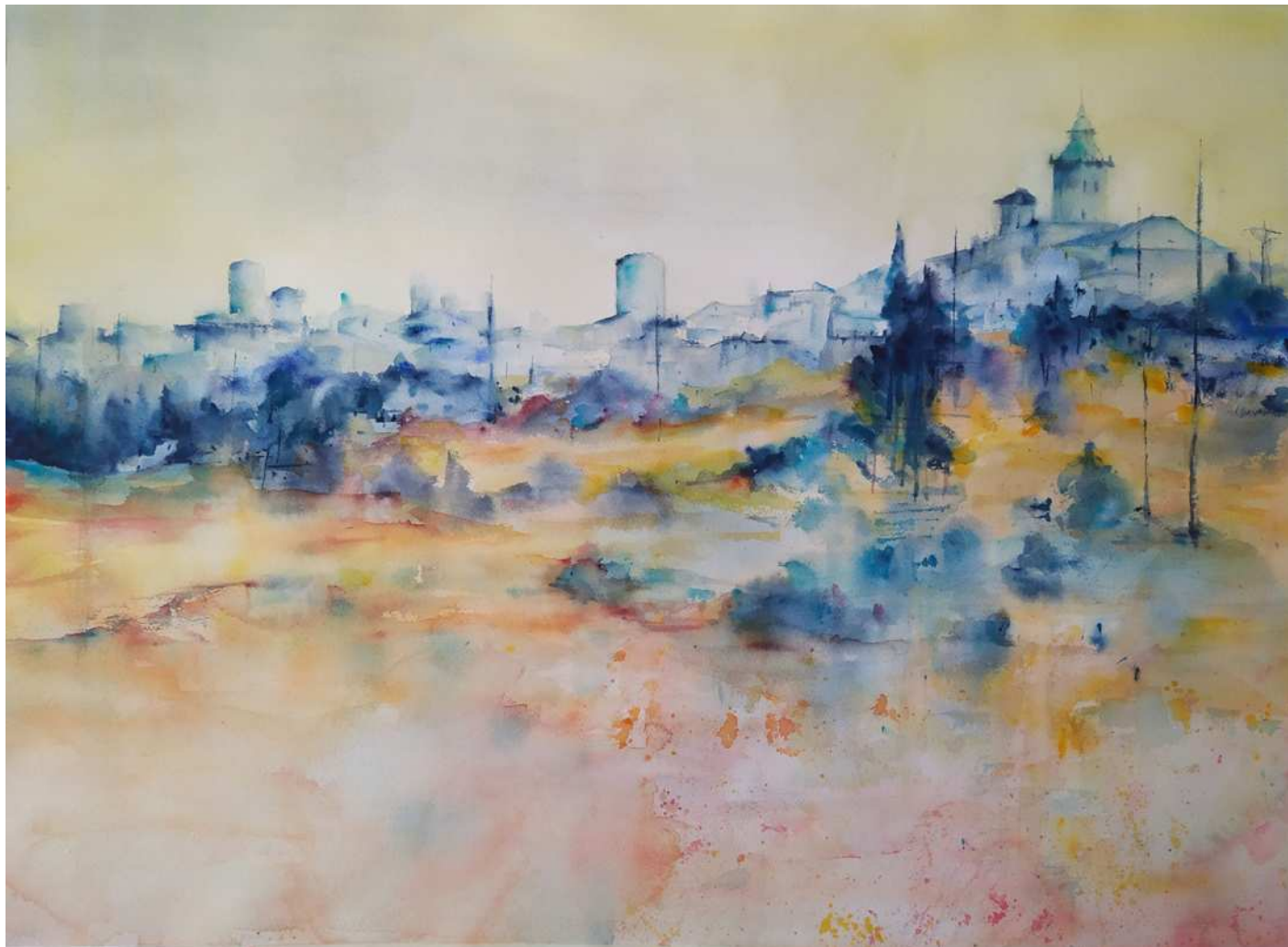
“ATARDECER EN SENCELLES “ 55x75 cm.