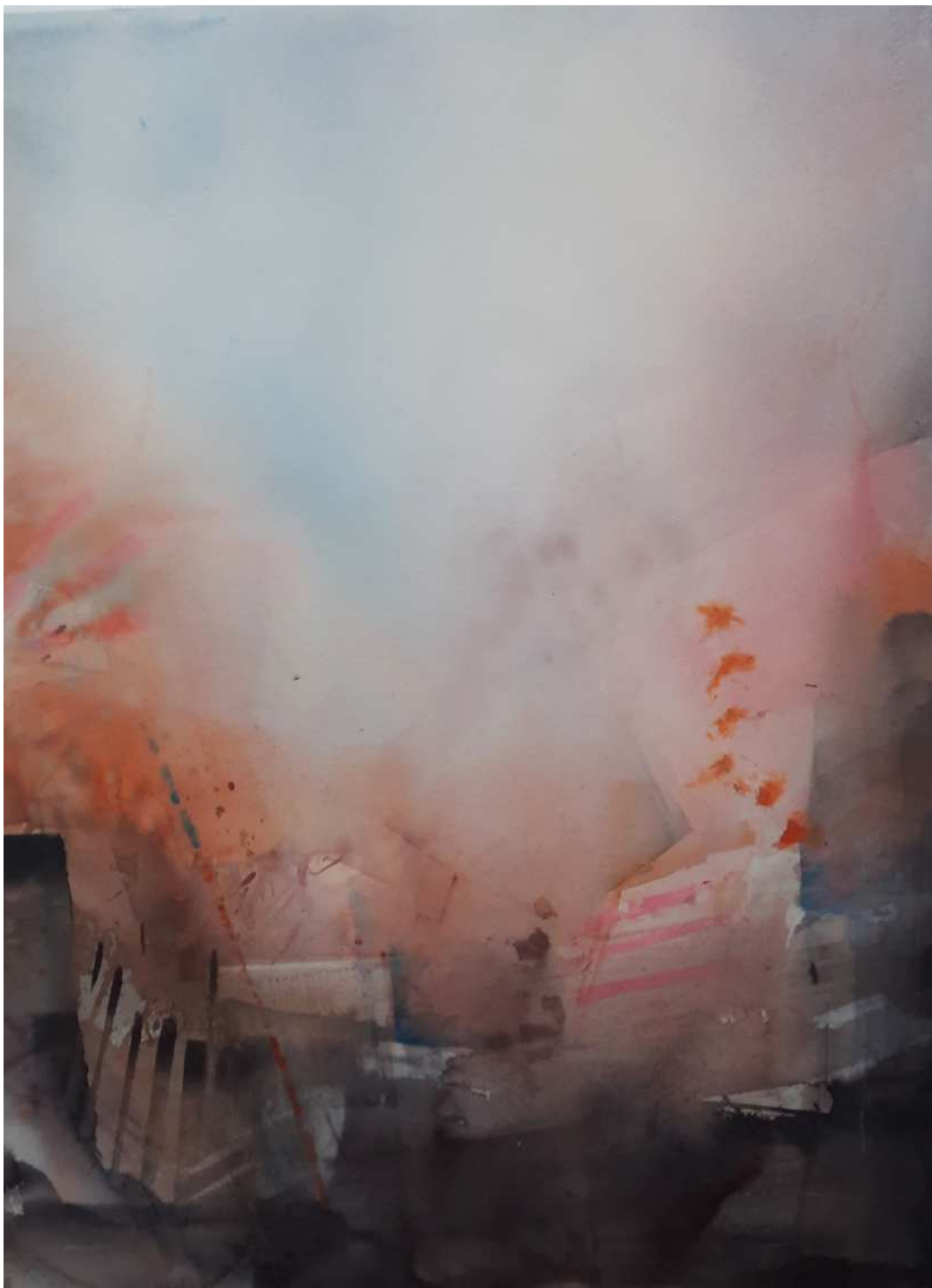
“DÉJAME DECIRTE” 63x85 cm.