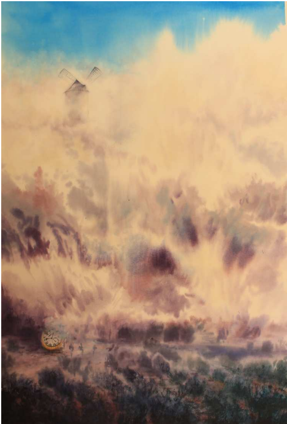
“LA FUGACIDAD DEL TIEMPO” 60x89 cm.