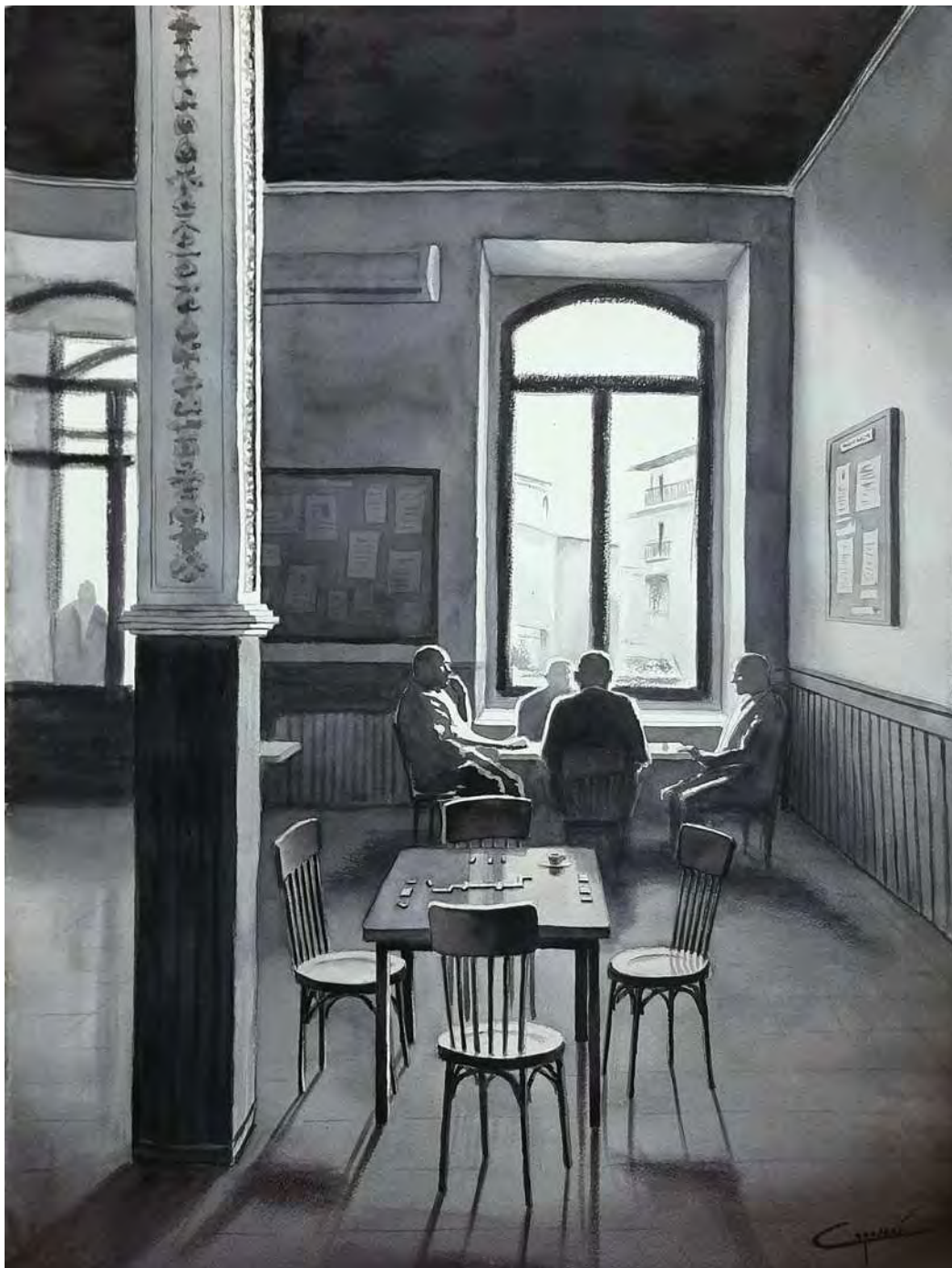
“LA PARTIDA. GRAN CASINO. TARAZONA DE LA MANCHA” 56x76 cm.