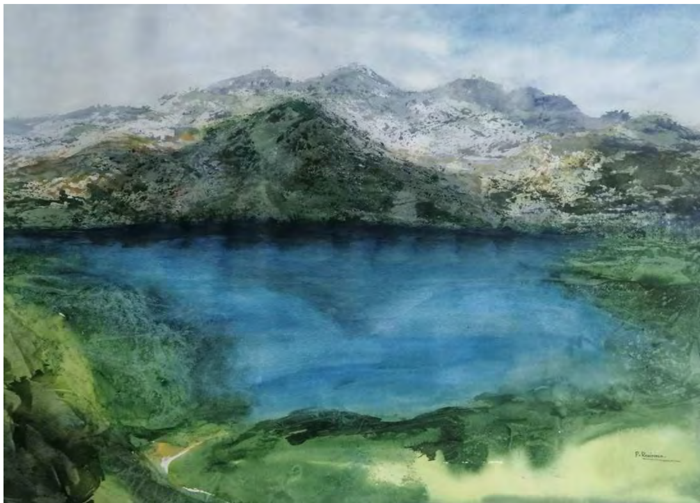
“PICOS DE EUROPA” 100x70 cm.