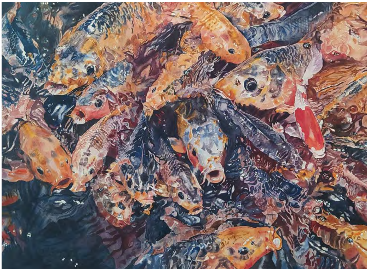
“EL INTRUSO” 75x55 cm.