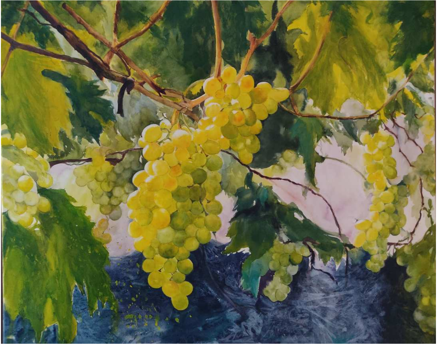
“DULCE MANJAR” 80,5x65 cm.