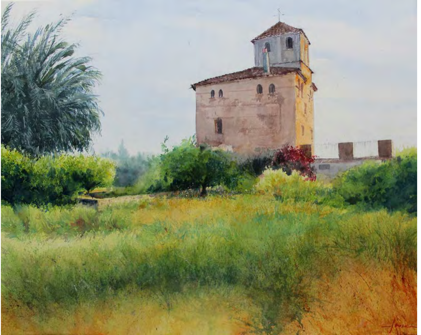
“CASA TORRE ALMODOVAR” 92x70 cm.