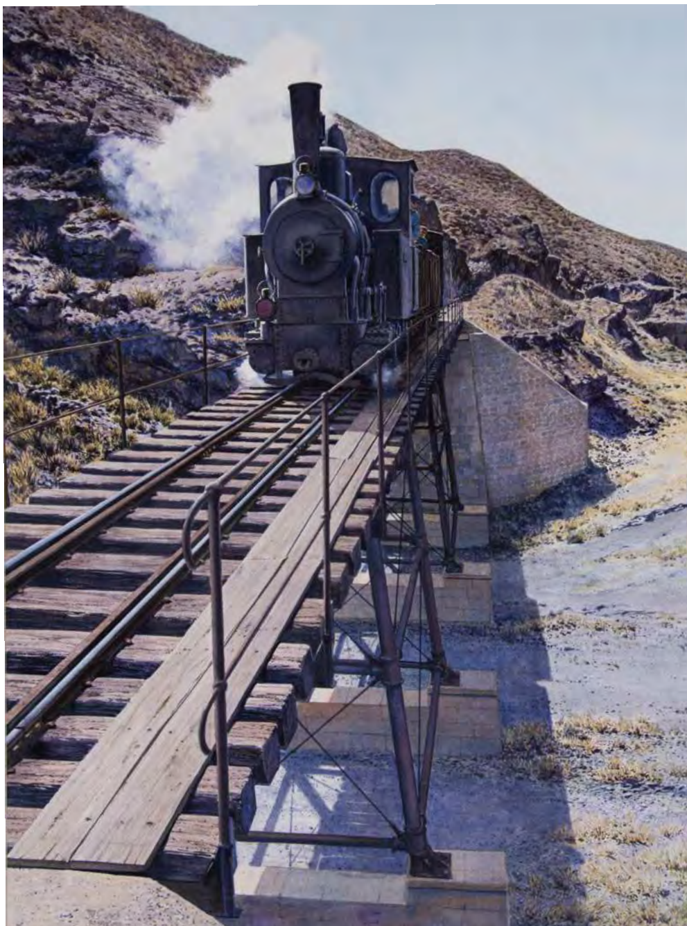
“FERROCARRIL MINERO DE SIERRA ALHAMILLA” 57x77 cm.