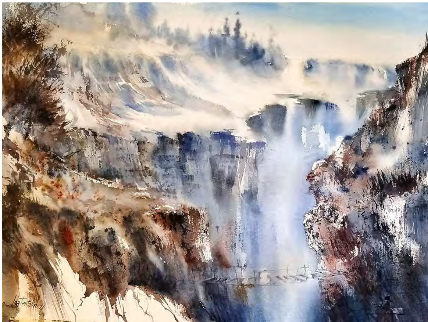
"PASSAGE" 55x75 cm.