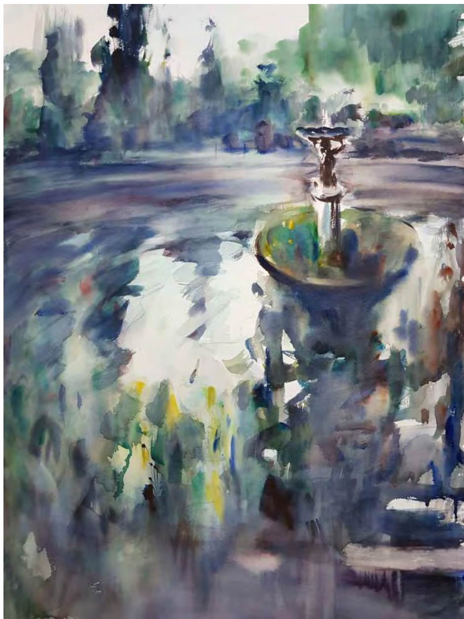
“ESTANQUE” 70x100 cm.