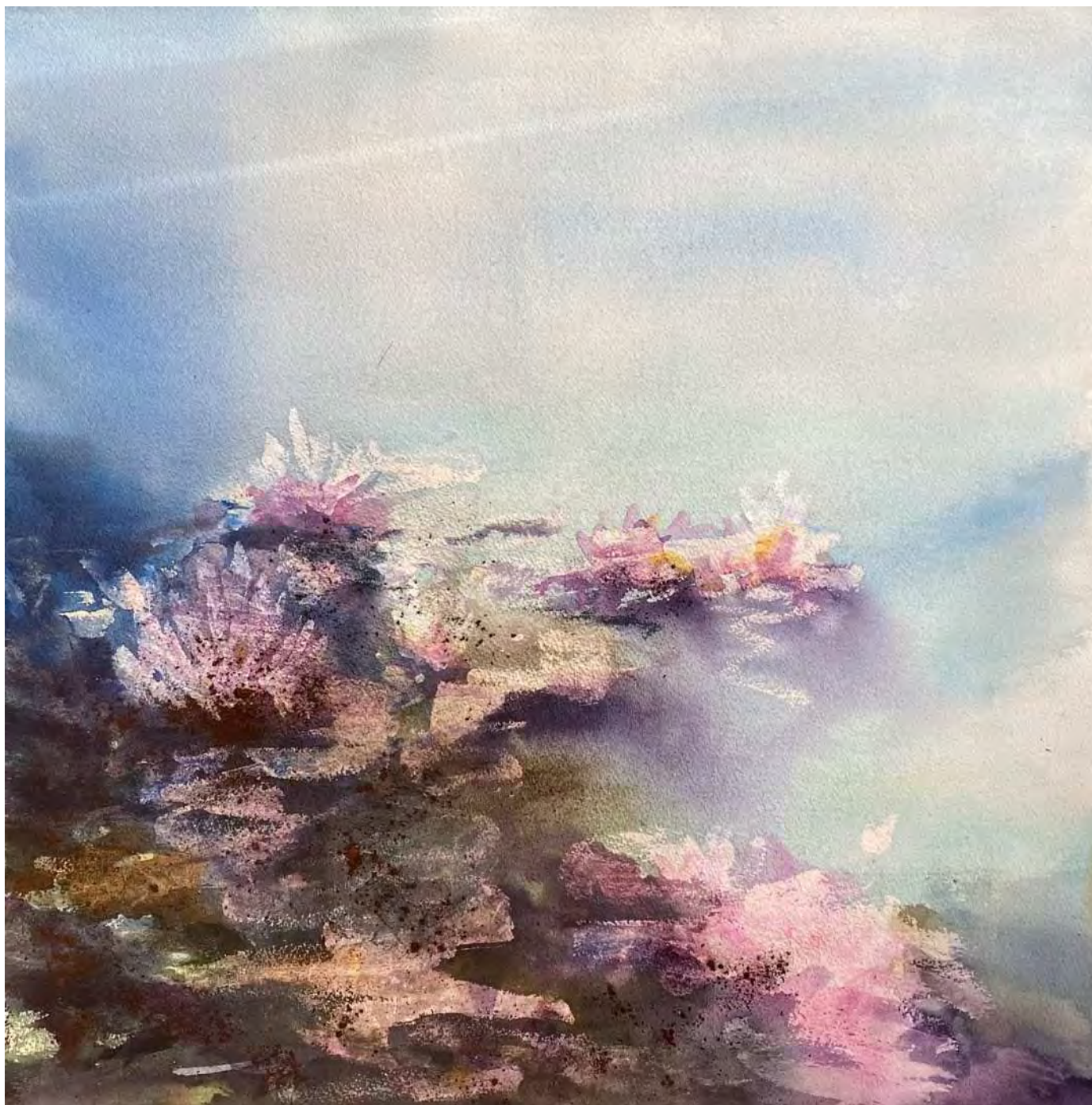
“LOS NENÚFARES DUERMEN EN LAS CUNAS DE AGUA” 56x56 cm.