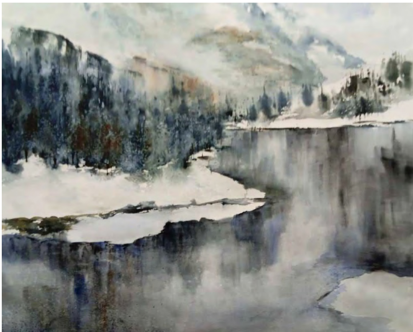
“CRUDO Y SOLITARIO INVIERNO” 76x56 cm.