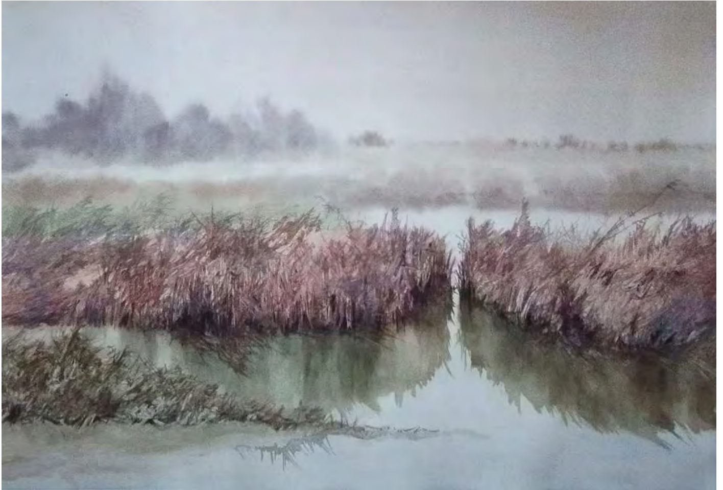
"DRY MARSHES 100x70 cm.