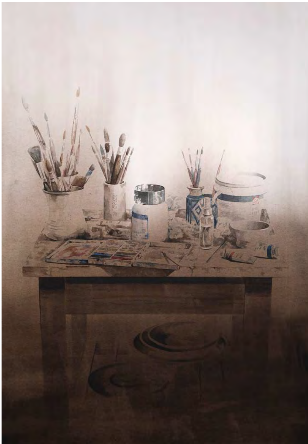
“LA MESA DEL PINTOR” 70x100 cm.