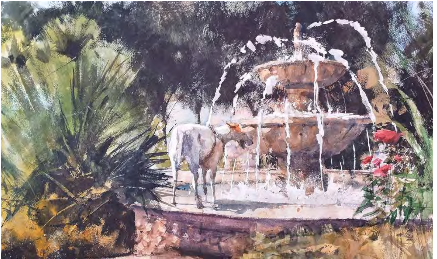
“OASIS “ 65x100 cm.