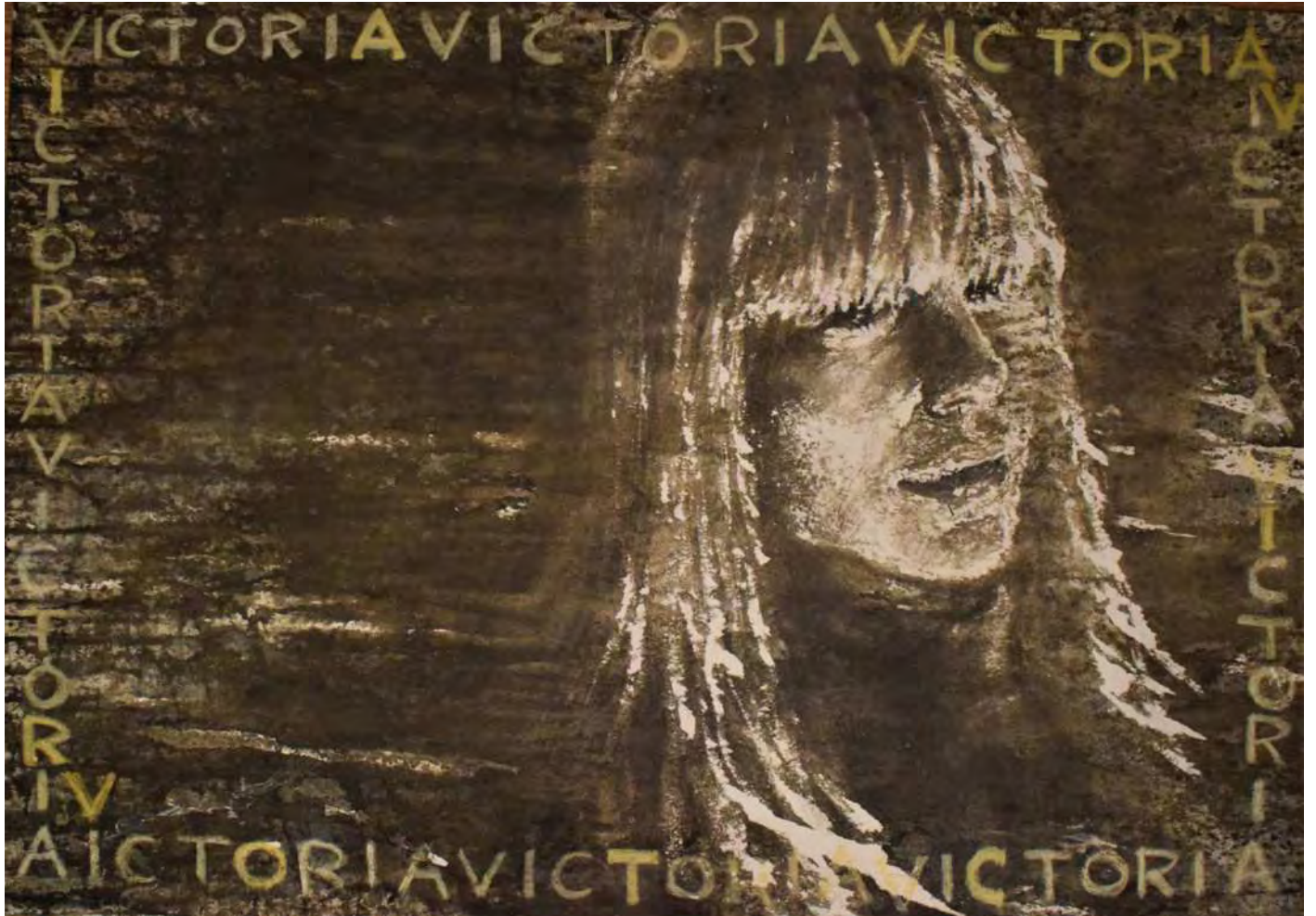
"VICTORIA" 100x70 cm.