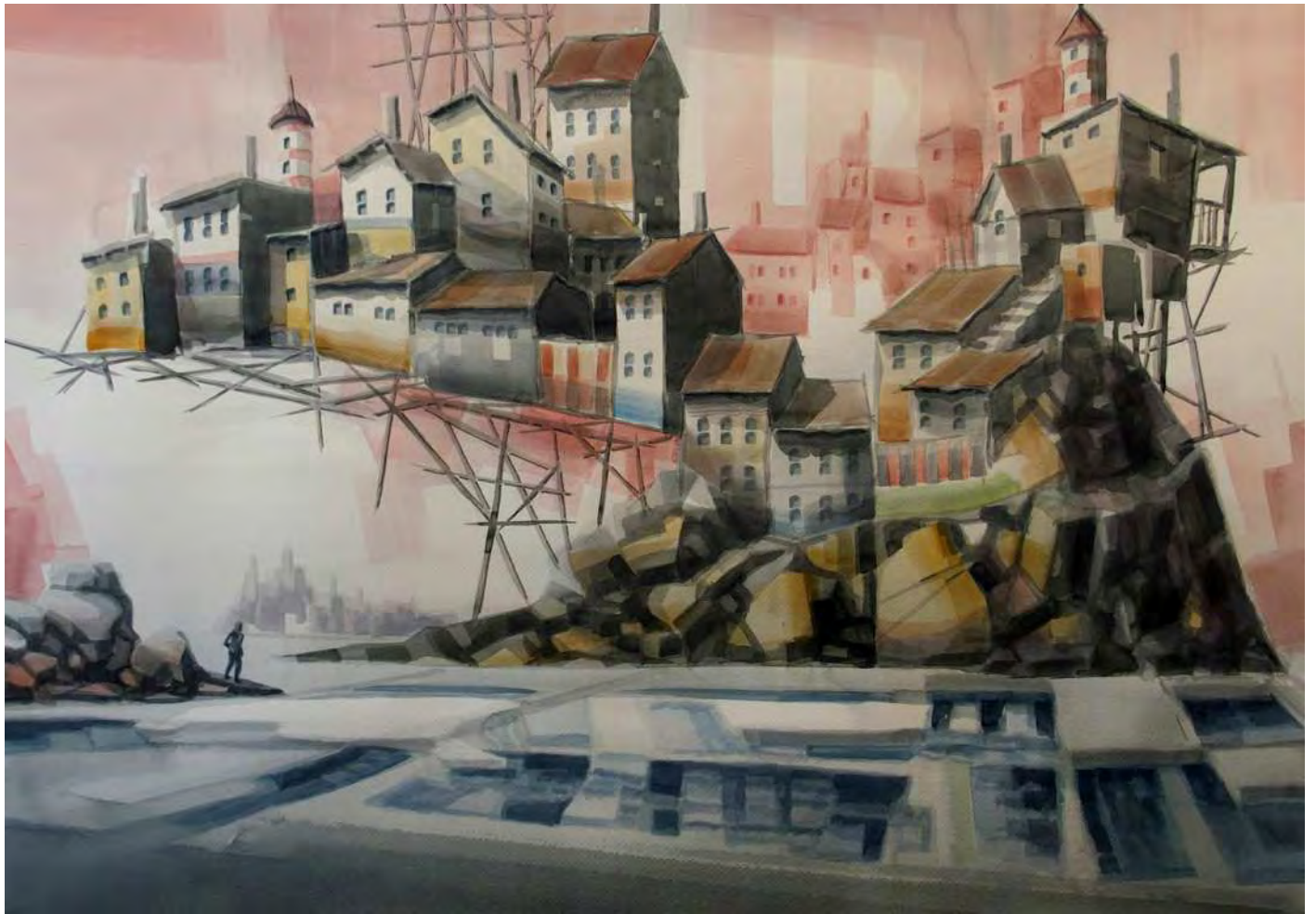
“FARO LAGONDRIZ” 92x66 cm.