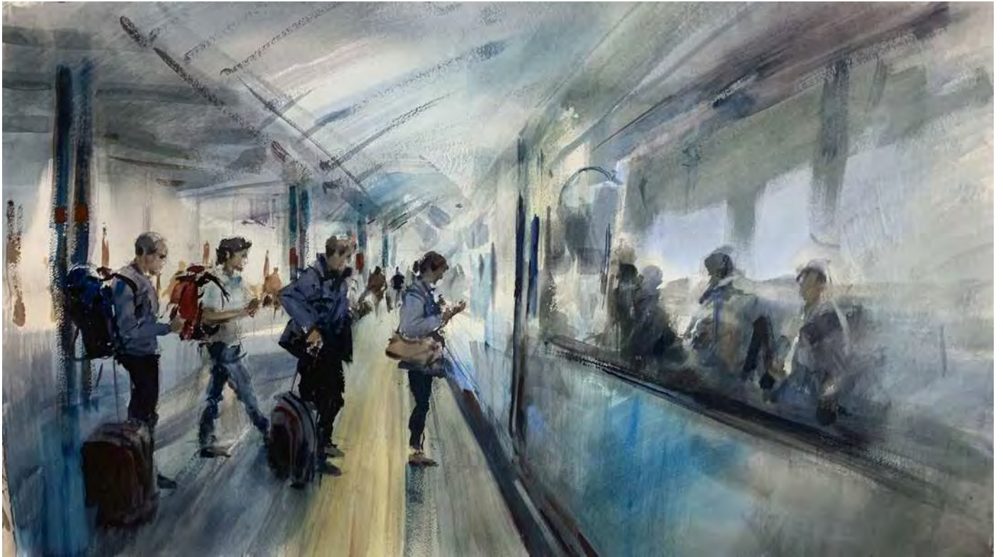
“ESPERANDO PARA ENTRAR AL TREN” 100x70 cm.