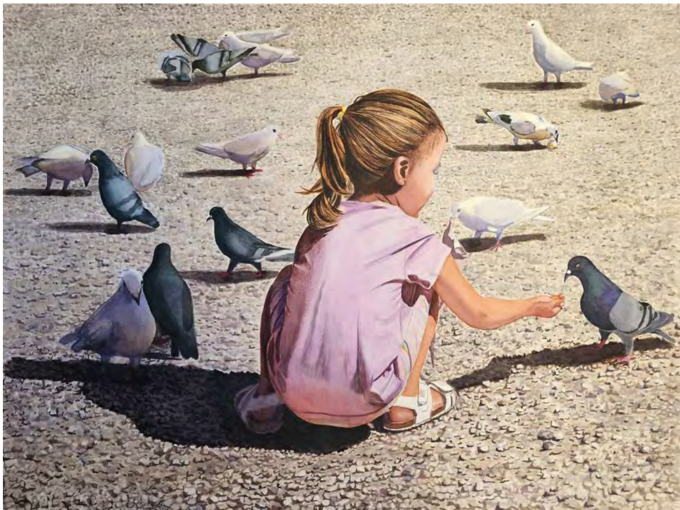
“LUCÍA Y LAS PALOMAS” 76x56 cm.