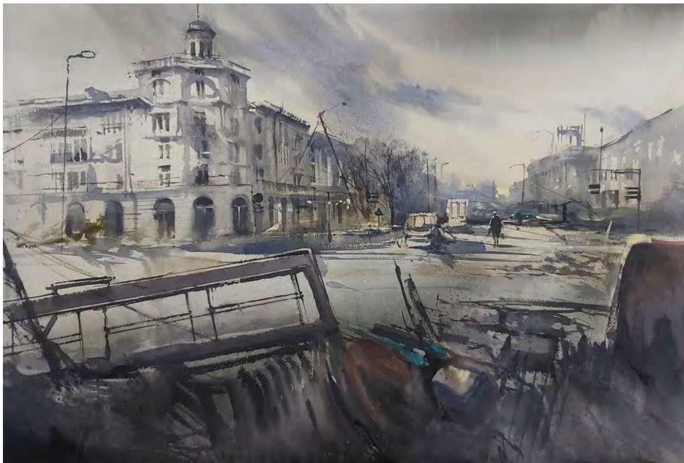
"HUELLAS, TEATRO DE MARIÚPOL, LA MAÑANA DESPUÉS" 100x70 cm.