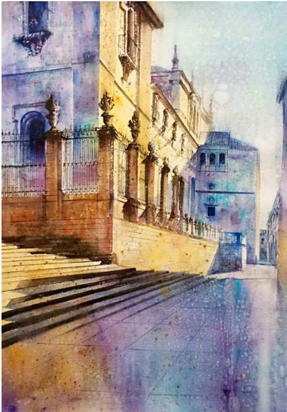
“RENACIMIENTO” 70x100 cm.