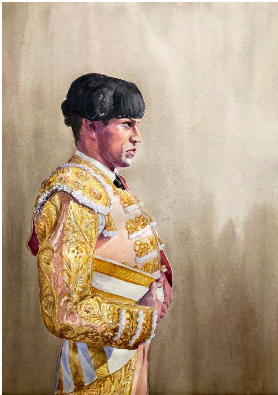
“EMPAQUE Y AL TORO” 55x70 cm.