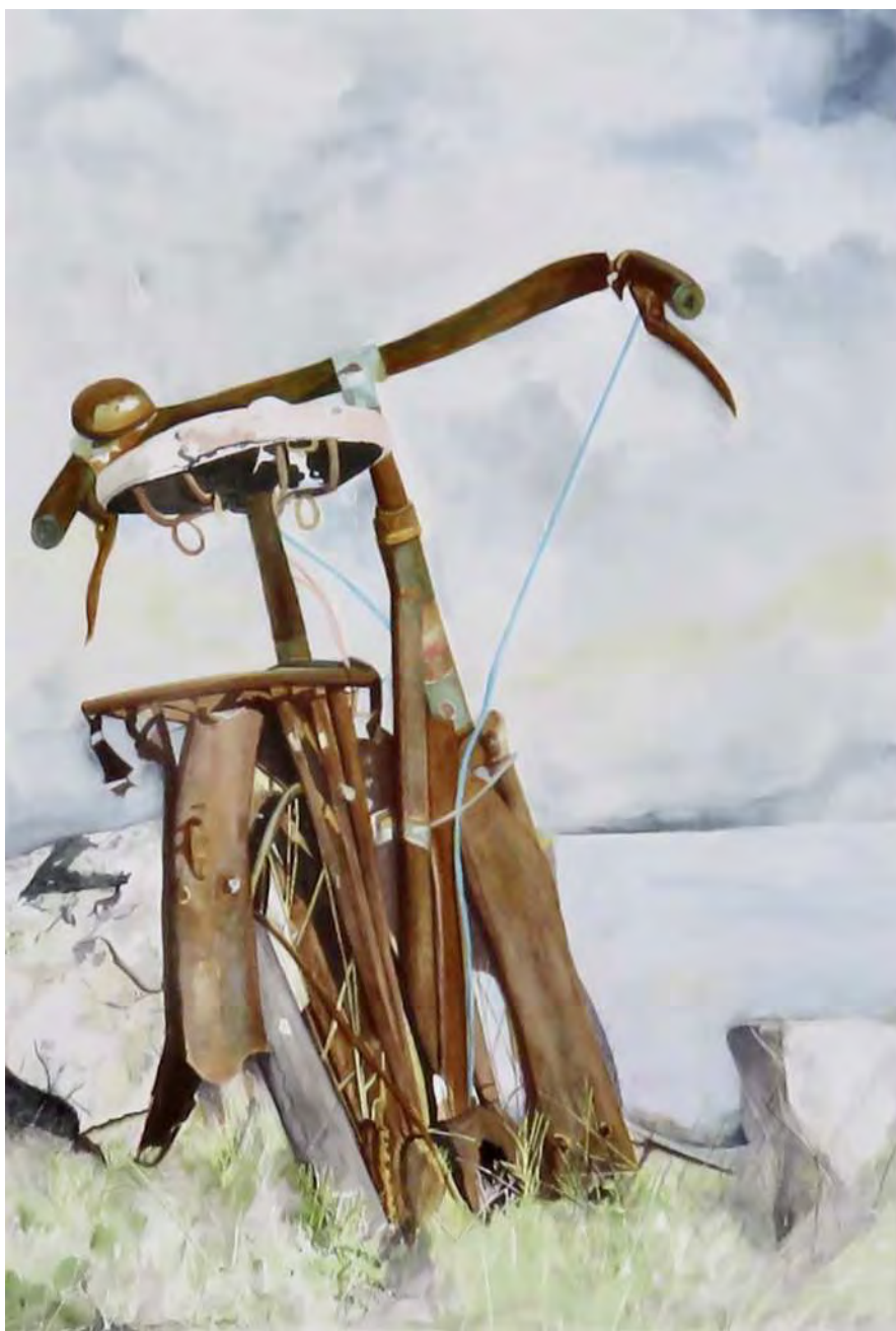
“VÉLO ABANDONNÉ (LA BICICLETA)” 60x80 cm.