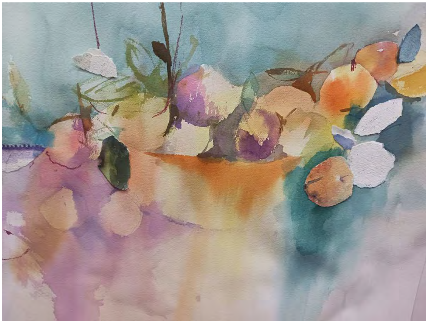
"STILL LIFE N°5" 65x55 cm.