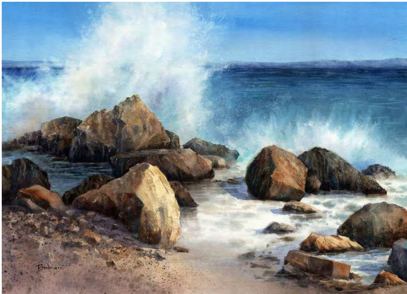
“FRENTE AL MAR, FRENTE A DIOS” 56x76 cm.