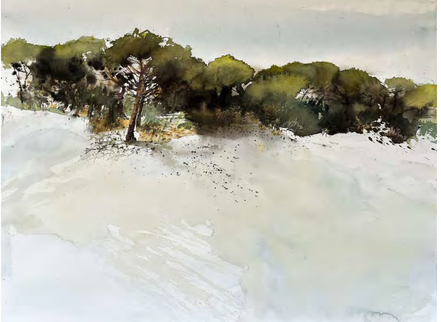
“LOOKING SOUTH 76x56 cm.