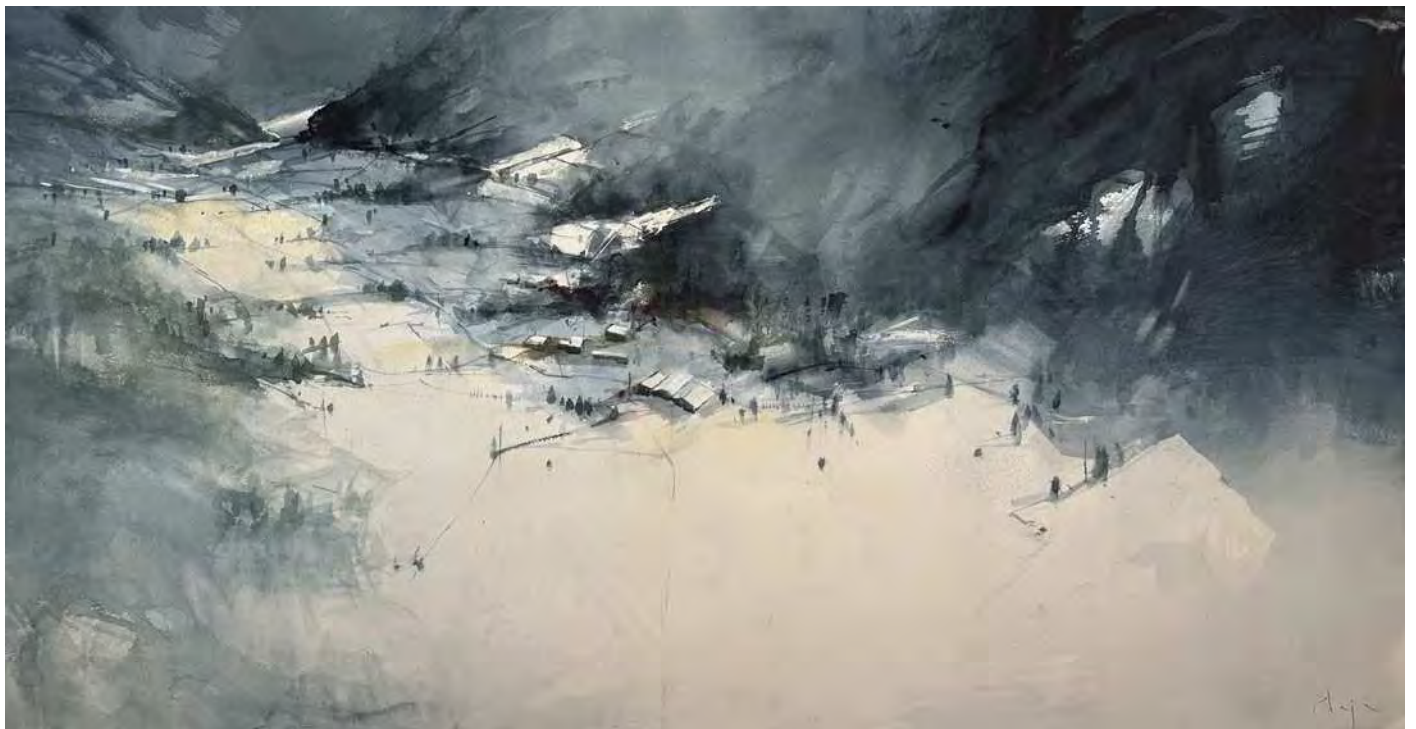
"VALLE SILENCIOSO" 100x55 cm.