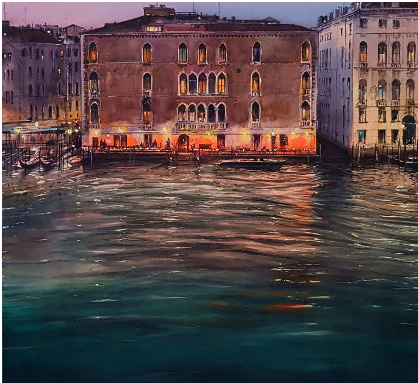
“UNA NOCHE EN VENECIA” 80x70 cm.