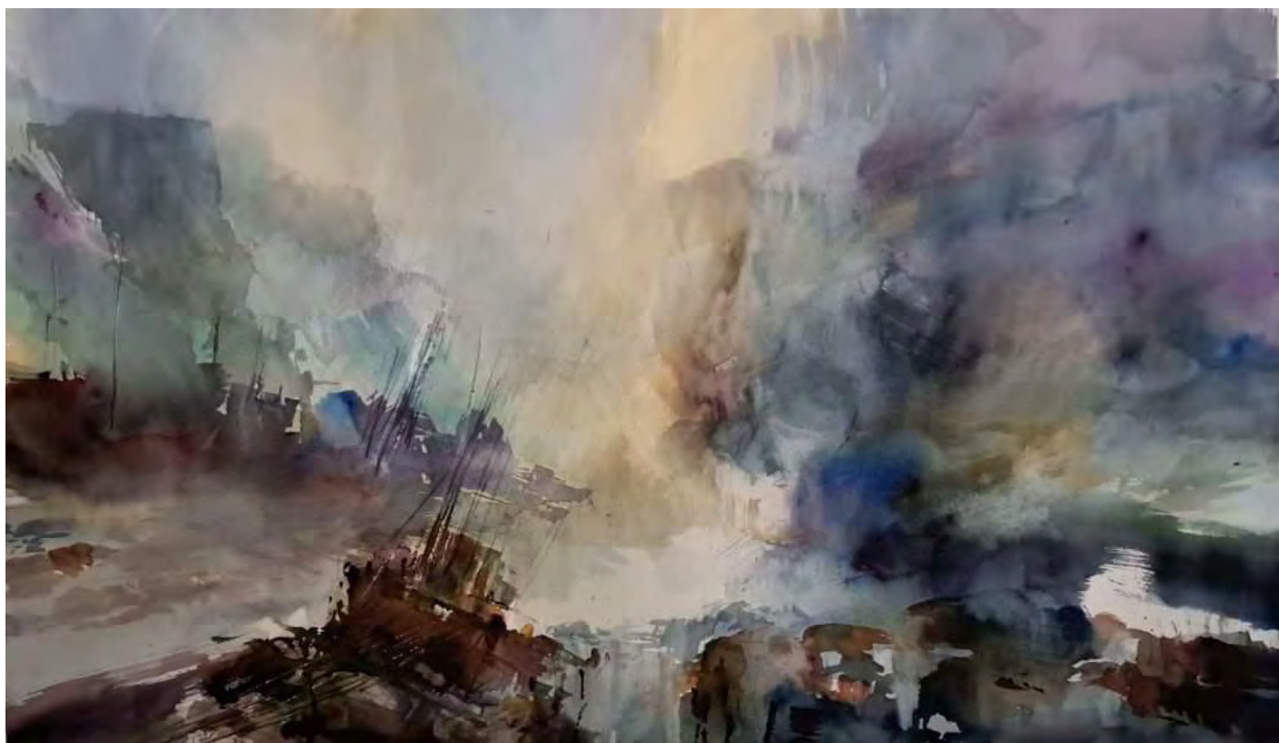
“INSINUACIÓN” 99x58 cm.